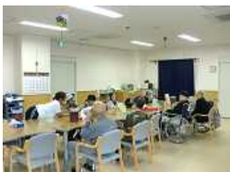
レクリエーション風景

月曜日～日曜日まで営業 しています。(年末年始の み休み) パワーリハビリを導入 し、くもん式学習療法も 行っています。