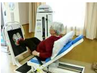
パワーリハビリ風景