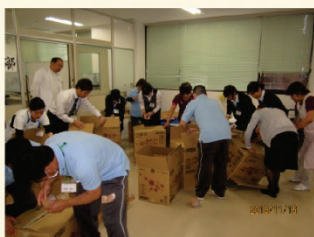
段ボールで簡易ベッド↓