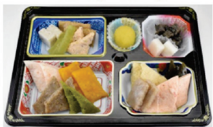
ソフト食・ゼリー食

お食事には、常食の他、糖尿病食や高血圧症食などの治療食、食べやすく食事形態を工夫したソフト食やゼリー食などのお食事があります。患者様のご意見を伺うために、嗜好調査なども行い、満足していただける食事提供に努めています。