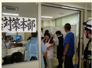
対策本部はリハビリ室に設置↓