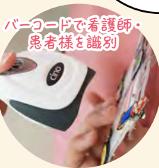
バーコードで看護師・患者様を識別

作業負担の軽減 測定から記録までの一連の作業時間が減ること、残業時間の軽減につながる可能性があります。