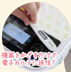
機器をかざすだけで電子カルテに送信!