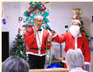
▲ 22日回復期リハ病棟

うした季節の行事を通して、患者様・利用者様に日々の生活の中で楽しみや潤いを感じていただけるよう、各施設が工夫を重ね、心を込めた取り組みを行っています。