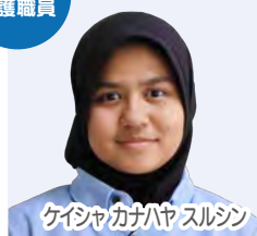
ケイヤカハヤスルシ