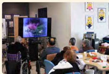
▲ 普段のカラオケの様子